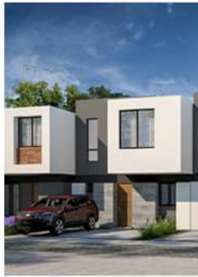
SOLÉ 3 RECÁMARAS