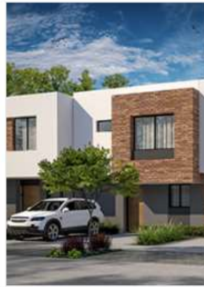
SOLARE 3 RECÁMARAS